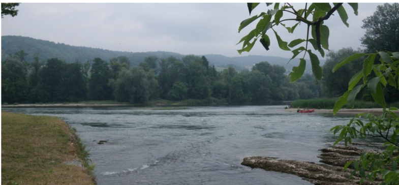
Vor dem Ziel: Zusammenfluss Reuss - Aare